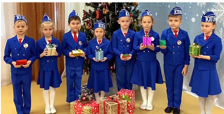
Команда ЮИД МБДОУ №4 г. Шахты Ростовской области поздравляет всех с наступающим Новым годом.