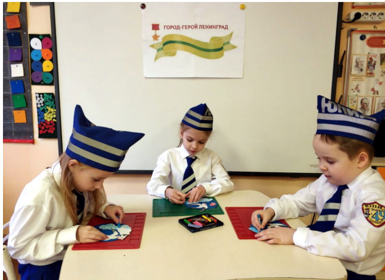
Весной 1942 года его начали носить на одежде многие жители Ленинграда – этот символ стал ответом на заявления немецкой пропаганды.

Это маленький жестяной значок, а на нем – ласточка с письмом в клюве.