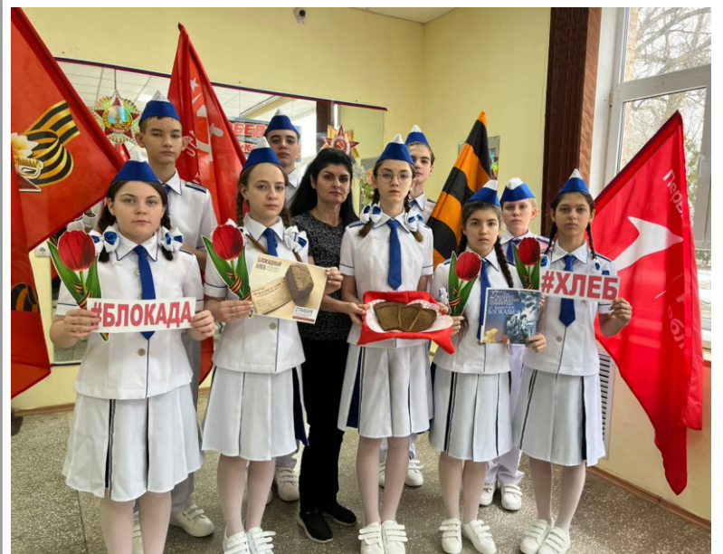
Отряд ЮИД «Патруль» Задонской СОШ Азовского района Ростовской области присоединился к всероссийской акции «Блокадный хлеб» и подготовил литературно-музыкальную композицию.